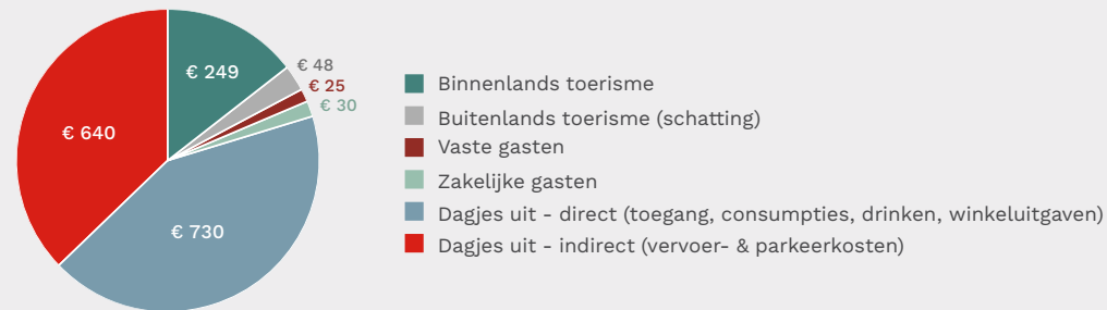
GRAFIEK 2: Bestedingen vrijetijdseconomie

Totale besteding Drentse vrijetijdsector: 1,7 miljard