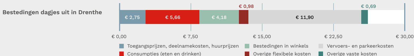
GRAFIEK 3: Gemiddelde besteding dagje uit in Drenthe.

Het Continu VrijeTijdsOnderzoek (CVTO) wordt eens per 3 jaar uitgevoerd; de laatste editie bevat data over 2018. Totaal ondernemen Nederlanders 53,8 miljoen uitstapjes in Drenthe, met een gemiddelde besteding van € 26,16. 63% van de uitstapjes in Drenthe wordt door de eigen inwoners gemaakt. Ruim een derde wordt door bewoners van andere provincies gemaakt (19,7 miljoen).